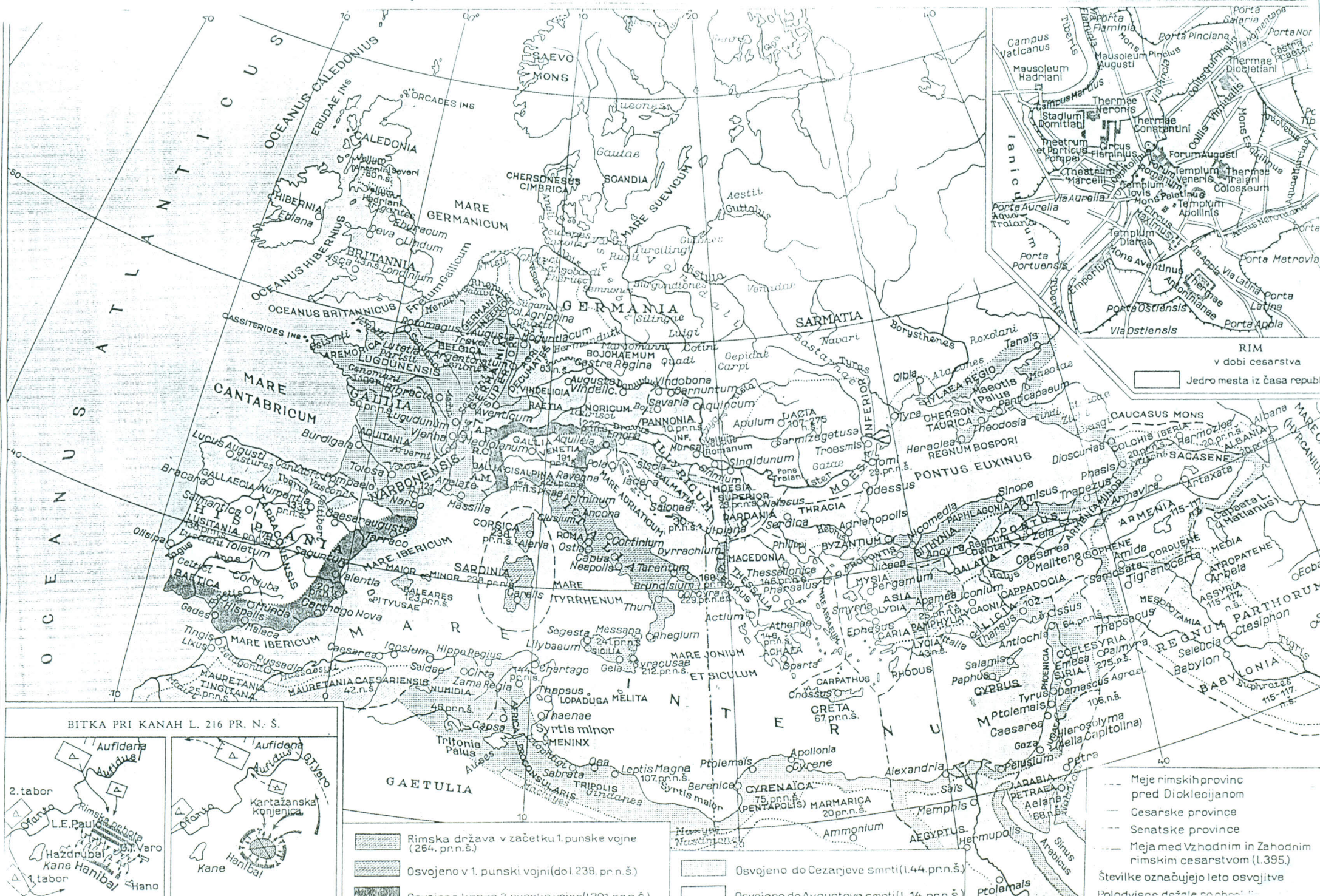
BITKA PRI KANAH L. 216 PR. N. S.