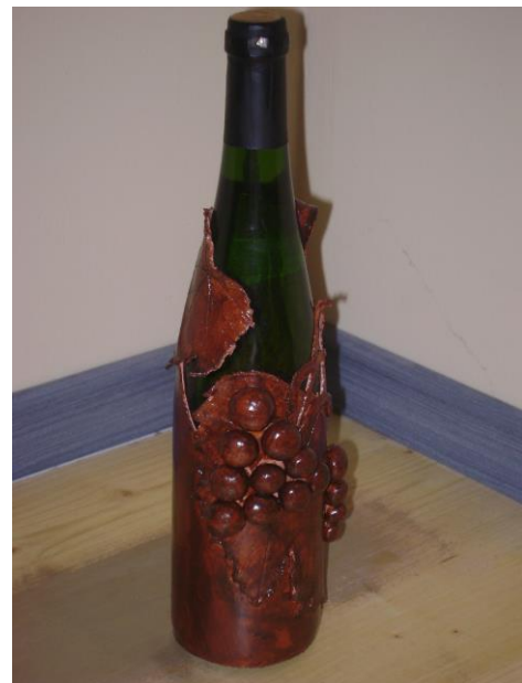
Sliki: dekorirani buteljki