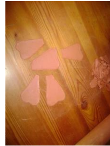
Slika: priprava delov za svetilko