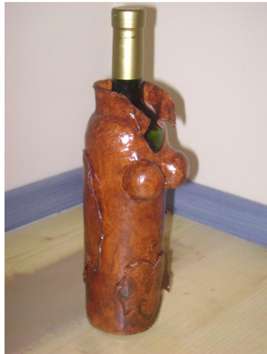
Sliki: dekorirani buteljki

Mehka masa pod velikimi in majhnimi prsti dobiva ustrezno obliko. Pri delu z das maso se poskusite popolnoma sprostiti in dobili boste izdelek, ki bo izhajal iz vašega počutja in duševnega stanja.