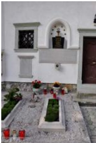
Grob Jakoba Aljaža

Jakob Aljaž je na Dovjem preživel 37 let svojega zelo dejavnega življenja. Na Dovjem, kjer se je najbolje počutil, je tudi umrl 4. maja 1927 v 82. letu starosti.