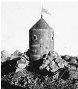
Aljažev stolp, 1895

Načrtoval in financiral je majhen valjast stolp iz debele pocinkane pločevine, ki naj bi nadomestil propadajočo leseno triangulacijsko piramido na vrhu. S postavitvijo stolpa, leta 1895 je Aljaž dal Nemcem jasno vedeti, da je Triglav slovenski.