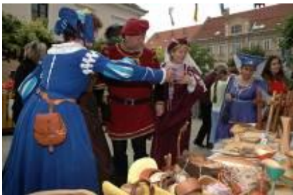
na srednjeveški tržnici

http://www.slo-foto.net/ftopict-5489.html