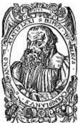
Primož Trubar, Jakob Lederlein, lesorez, 1578

Za razvoj slovenskega naroda je imel velik pomen protestantizem. Leta 1550 je reformator Primož Trubar izdal prvo knjigo v slovenščini: Katekizem. Jurij Dalmatin pa je v slovenščino prevedel Sveto pismo. Slovenščina je s tem enakopravno stopila v kulturni krog drugih evropskih narodov in jezikov.