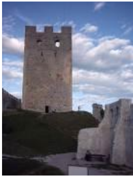
Friderikov stolp na Celjskem gradu http://sl.wikipedia.org/wiki/Celjski_grofje

Prevlado Habsburžanov je ogrožala edina slovenska plemiška rodbina Celjskih grofov, ki pa so v drugi polovici 15. stoletja izumrli. Vse slovensko ozemlje z izjemo primorskih mest je prišlo v roke Habsburžanov.