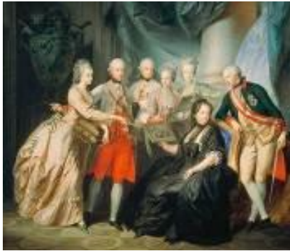
Cesarica Marija Terezija s člani družine 1776.leta.