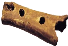
Piščal iz Divjih bab

Ozemlje današnje Slovenije so predniki človeka poseljevali že pred 250 tisoč leti. Iz tega obdobja sta ohranjeni kamniti orodji iz Jame v Lozi pri Orehku. Kakih 55 tisoč let je stara naluknjana kost iz podzemne jame Divje babe, ki velja za najstarejšo piščal na svetu. Hrani jo Narodni muzej Slovenije.