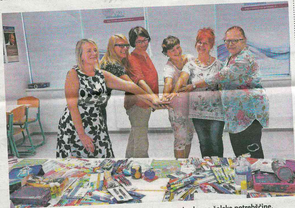
V petek so predstavnice jeseniških osnovnih šol prevzele zbrane šolske potrebščine.