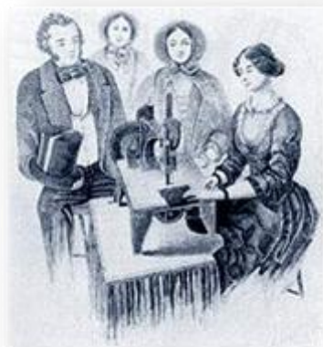
Šivalni stroj Singer c. 1853