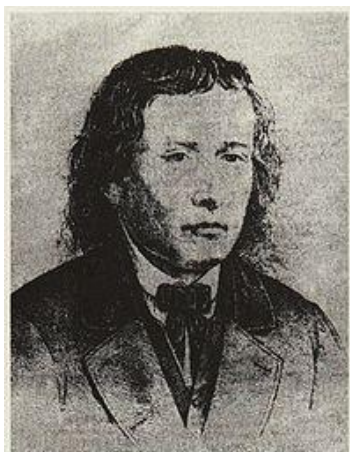
Ena od dveh domnevnih fotografij, objavljenih v Wagnerjevi litografiji