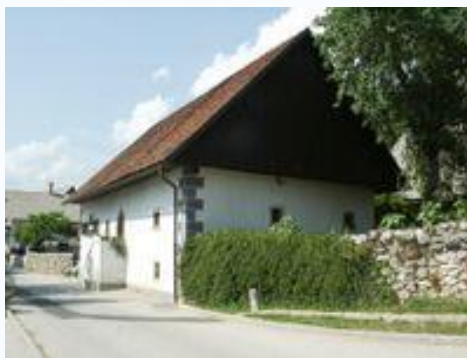
Pesnikova rojstna hiša v Vrbi