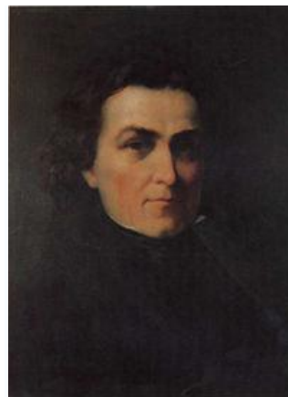
France Prešeren, portret Božidarja Jakca, 1940

France Prešeren, slovenski pesnik in pravnik, * 3. december 1800, Vrba na Gorenjskem, † 8. februar 1849, Kranj.