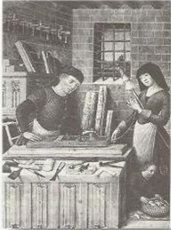
Delavnica v meščanski hiši. Oče je tesar, na stenah in mizi pred njim je razloženo njegovo orodje. Mati prede.