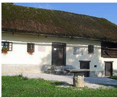
Jurčičeva rojstna hiša