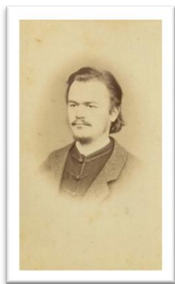
S. Volkmann: Josip Jurčič, 1865–1881,