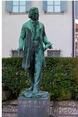
Jurčičev kip v Mariboru

Josip Jurčič se je rodil na Muljavi, na vasi blizu Višnje Gore. Vaško življenje mu je bilo zelo všeč in ga je spremljal zelo pozorno. Poslušal je mnoge vaške posebneže, berače in druge domačine in okoliške ljudi, ki so se oglasili v njihovi domači branjariji in žganjarni. Tako je poslušal pravljice in pripovedke ljudskega izročila in s tem se je razvijala njegova ljubezen do ljudskega blaga, domišljija in ljubezen do preprostih kmečkih ljudi, katerim je pripadal tudi sam. Veliko je k temu pripomogel njegov ded, ki ga je zelo dobro opisal skupaj z vsemi slišanimi anekdotami v Spominih na deda (1863). Josip Jurčič je jemal tematiko in snov za svoja dela iz domačega kmečkega okolja, torej preproste protagoniste in preprosto tematiko, ki se vrti okoli težav in smešnih dogodkov malega človeka iz ruralnega okolja.