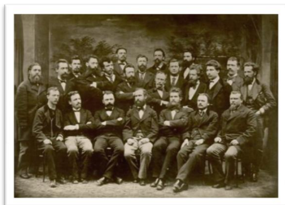
Jurčičeva družba v hotelu Evropa sredi 70-let, Jurčič je drugi z desne v spodnji vrsti,

V Mariboru je bil pomočnik glavnega urednika pri časniku Slovenski narod , dve leti kasneje je postal njegov glavni urednik in se preselil v Ljubljano. Leta 1872 je objavil znano kratko pripoved Telečja pečenka . Nekaj let kasneje je objavil romane Doktor Zober , Med dvema stoloma , Lepa Vida in Cvet in sad ter tragedijo Tugomer , ki jo je predelal Fran Levstik.