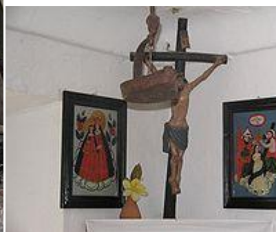
Bohkov kotek v hiši