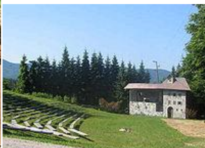
Gledališče na prostem