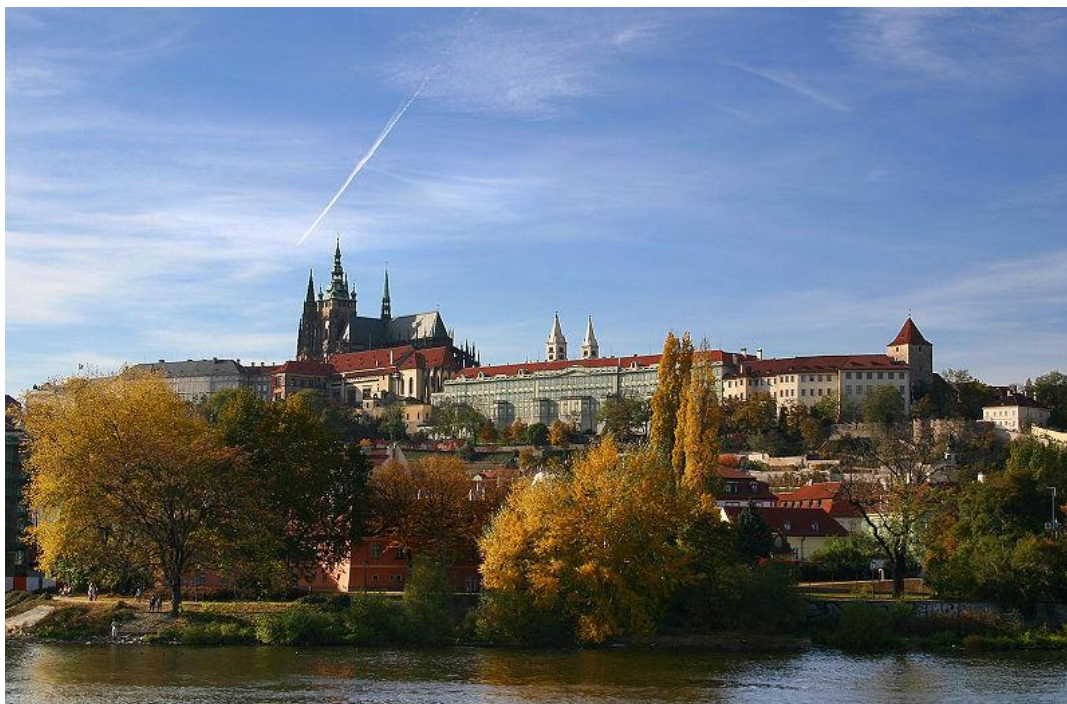
Praški grad ob reki Vltavi

V Trstu je leta 1898 začela pošiljati svoje »resnične podobe iz življenja« pa tudi plodove svoje domišljije, raznim listom: Slovenki in Edinosti v Trst, Slovenskemu narodu , Domu in svetu ; in ti so jih začeli objavljati. Kasneje ji je eden od pisarniških predstojnikov prepovedal pisati . Dejal ji je, da če pa že mora pisati, naj piše pod moškim imenom. Nekaj časa je pisala pod psevdonimom Kopriva . Pod tem psevdonimom je izšla avtobiografska črtica Moja prijateljica (1900). Leta 1900 je izdala tudi svojo prvo knjigo Misterij žene , ki je poleg njenih domačih izkušenj odsevala tudi njena tržaška odkritja. V teh črticah se zato prepletajo bolečine kmečkih, delavskih, mestnih in meščanskih žensk. Dramske spise je zbrala v knjigi Ljubzen (1901). Sledile so ji zbirke Odsevi (1902), Iz naših krajev (1903) in Iskre (1905). Pomembnejša je socialna drama Amerikanci (1908), ki prikazuje revščino in razočaranje kot vzroke za odseljevanje. Z bolečino, ki ji jo je prizadejalo očetovo pijančevanje se spopada v precej svojih delih, zlasti v noveli V oblasti teme in romanu Njeno življenje (1918). To delo je bilo zadnje, ki ga je napisala v slovenščini. Po tem je pisala v srbskem in hrvaškem jeziku (roman Hanka, Jedanaest novela, drama Unuk kraljevića Marka...). Objavljala je tudi v nemških in čeških časopisih.