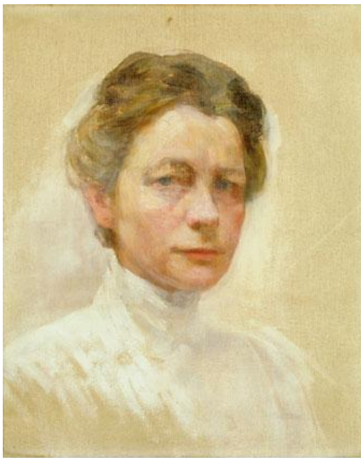
Avtoportret v belem