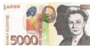
upodobitev na bankovcu

Ivana Kobilica , slovenska slikarka, * 20. december 1861 , Ljubljana, † 4. december 1926