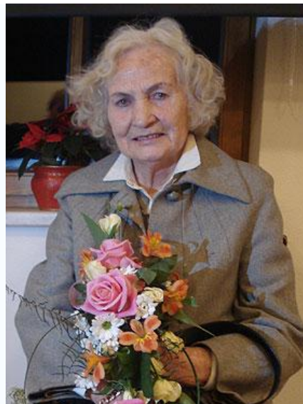
Mimi Malenšek ob 90 - letnici

Mimi Malenšek , slovenska pisateljica in prevajalka, * 8. februar 1919, Dobrla vas na Koroškem