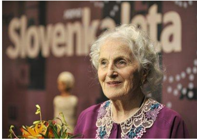
otročka pesnica in Slovenka leta 2008

Rojena je 22. decembra 1930 v vasi Podvin pri Polzeli.