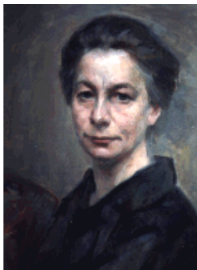
Ivana Kobilica – avtoportret