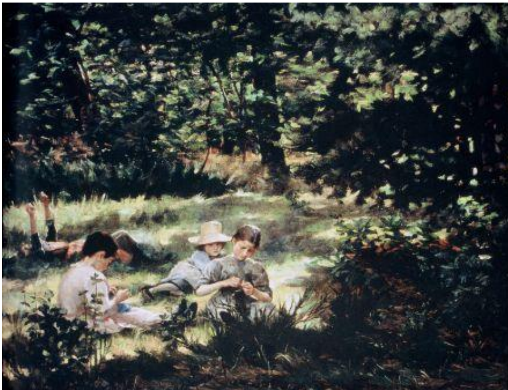
Otroci v travi

Operacijo delno financira Evropska unija iz Evropskega socialnega sklada ter Ministrstvo za šolstvo in šport. Operacija se izvaja v okviru Operativnega programa razvoja človeških virov za obdobje 2007 – 2013, razvojne prioritete: Razvoj človeških virov in vseživljenjskega učenja; prednostne usmeritve: Izboljšanje kakovosti in učinkovitosti sistemov izobraževanja in usposabljanja.