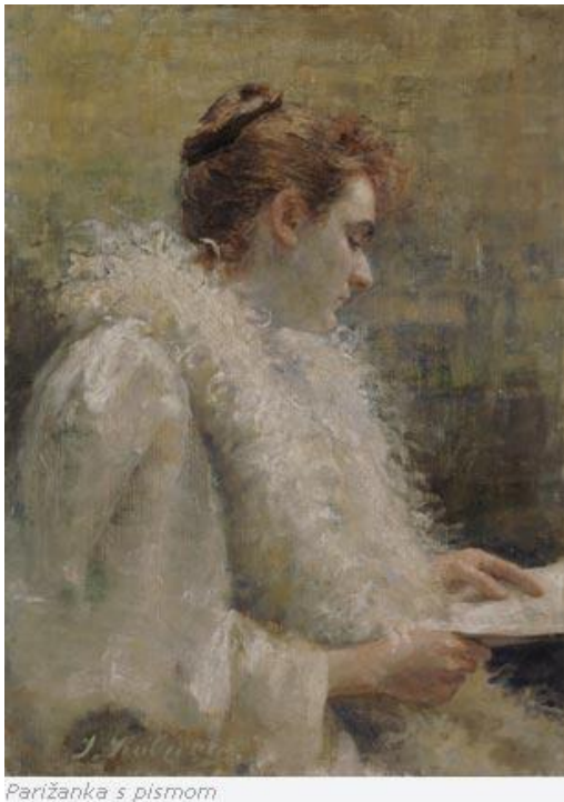
Parižanka s pismom