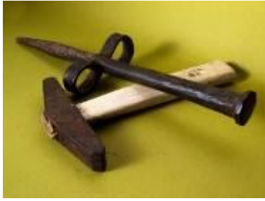
Babca in kladivo za klepanje kose med košnjo.

Vsak pravi kosец je moral znati svojo koso tudi nabrusiti z brusnim kamnom (oslo). Rekli so: »Kdor zna brusiti, zna tudi kositi!« Da bi kose bolje rezale, so imeli nekateri navado priliti v osovnik ( oselnik ) nekaj kapljic kisa ali mošta.